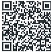
QR Code หลักเกณฑ์และแนวปฏิบัติการของงบประมาณ

- กลุ่มนโยบายและแผนของแจ้งซักซ้อมหลักเกณฑ์และแนวปฏิบัติการของงบประมาณ งบดำเนินงาน รายการปรับปรุงซ่อมแซมระบบไฟฟ้า ประปา โดยมีรายละเอียดดังนี้