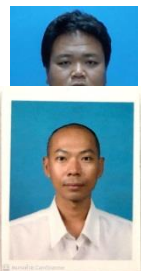
เจ้าหน้าที่ ลอดภัย